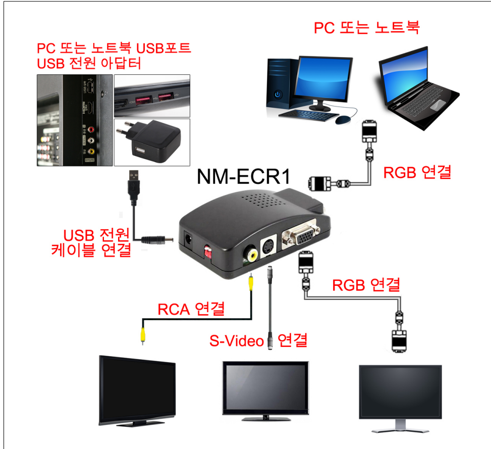
<NM-ECR1 제품 연결도>